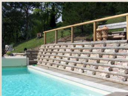
Exemples de murs en kits avec différentes finitions : habillage pierres, plantes vivaces, mixte